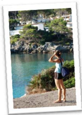
(Nico B. AnF Au Pair Palma de Mall. 2008)